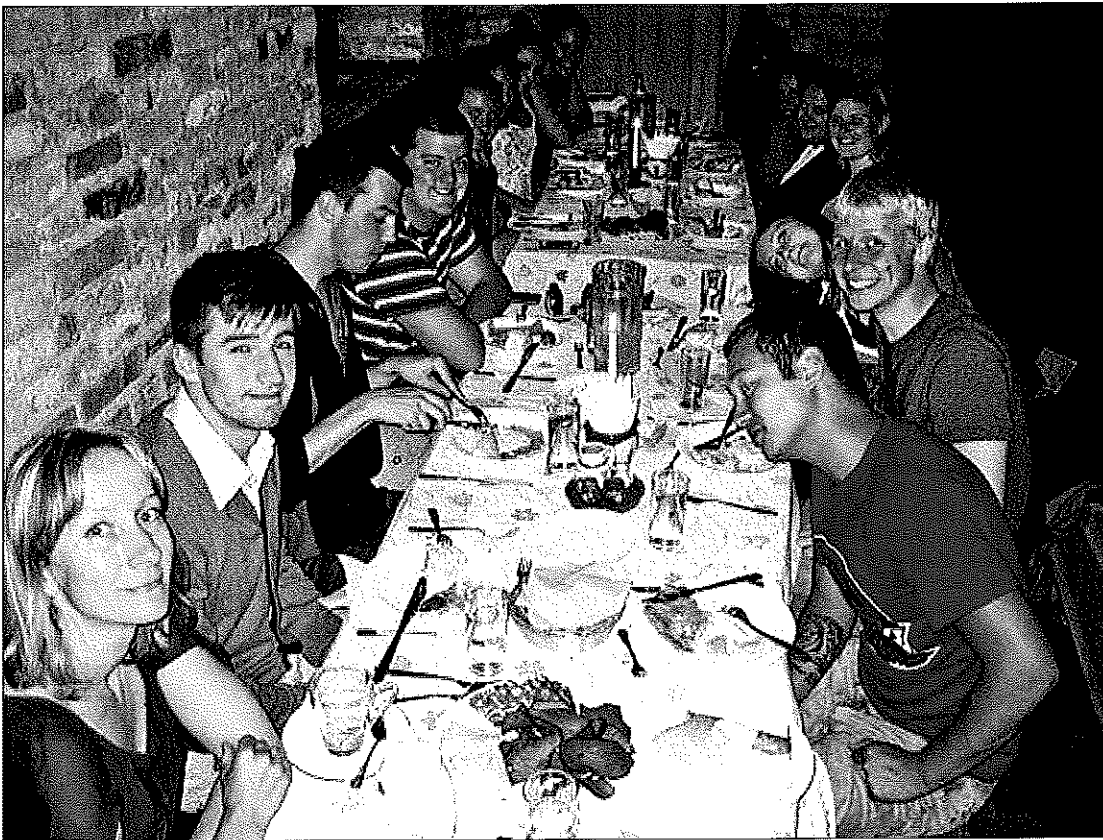
Atsisveikinimo vakaras „Marceliukės klėtyje“. Valgėme cepelinus ir šokome polką!

Draugas / 4545 W. 63rd St. / Chicago, IL 60629-5589 Tel: 773-585-9500 / Fax: 773-585-8284 / E-mail: administracija@draugas.org Site design: jrkuprys