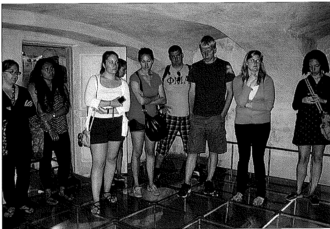
Genocido aukų muziejuje.