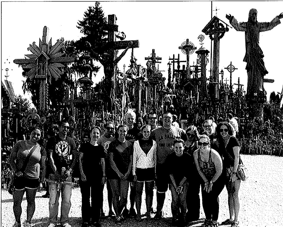
Prie Kryžių kalno.