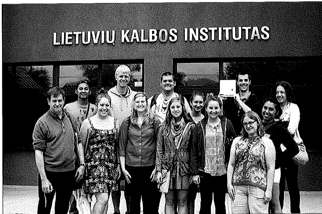
Lietuvių kalbos instituto muziejuje.