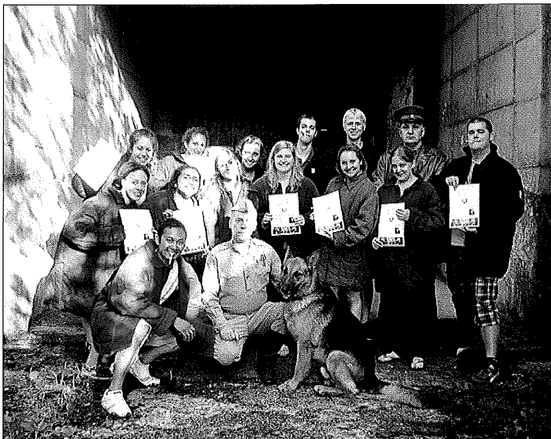
Spektaklis bunkeryje, kur studentai buvo TSRS piliečiai beveik tris valandas.